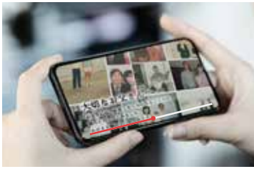
よせがきムービー