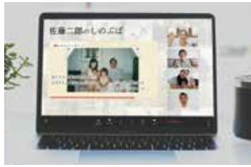
司会者を中心に 故人を偲ぶ会を開催